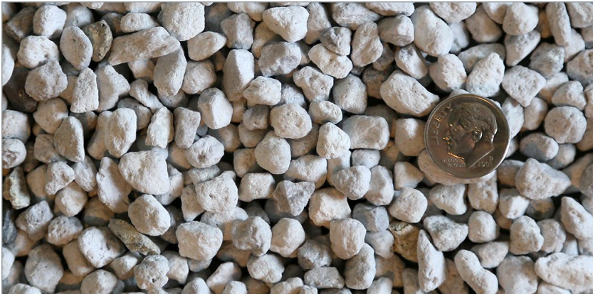
Piedras de grado de 5/16 de pulgada secas, limpias y libres de finos.

47 lb/por pie cúbico [753 kg/por metro cúbico] (ASTM C29)